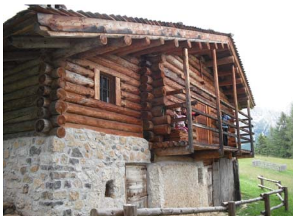
Baita alpina in legno con piano terra in muratura.

Queste sostanze presentano alta tossicità verso gli organismi xilofagi ( insetti che vivono nel legno e di esso si nutrono, muffe e funghi ) e minore tossicità verso i mammiferi come l'uomo. Generalmente sono derivati dalla distillazione del carbon fossile (creosoto), sostanze in solventi organici e gas e più in generale fungicidi ed insetticidi ad azione combinata. Per il legname impiegato in edilizia a questi si aggiungono igniritardanti per incrementare il tempo di resistenza delle strutture sotto attacco del fuoco.